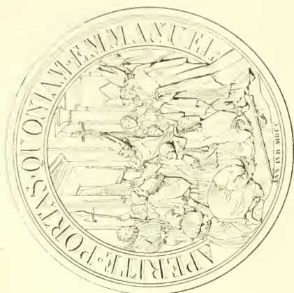
Terr. du Cabinet de N. de Nemours